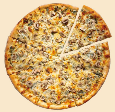
ホウレン草 & マッシュルーム SPINACH MUSHROOMS SLICE: ¥720 (¥778) WHOLE: ¥4900 (¥5292) (8SLICES)