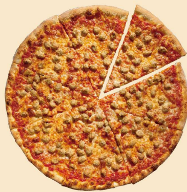
イタリアンソーセージ ITALIAN SAUSAGE SLICE: 650 (¥702) WHOLE: ¥4500 (¥4860) (8SLICES)