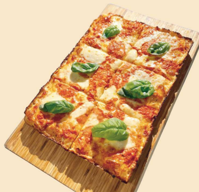
ウォッカ VODKA SLICE: ¥550 (¥594) WHOLE: ¥4200 (¥4536) (8SLICES)