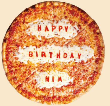
バースデーピザ (ラウンド) BIRTHDAY PIZZA YOU CAN ADD ANY MESSAGE ¥5500~ (¥5940~)