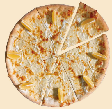
レモン & ハニー LEMON & HONEY SLICE: ¥650 (¥702) WHOLE: ¥4500 (¥4860) (8SLICES)