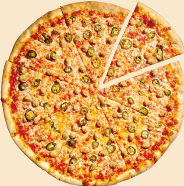
ソーセージ & ハラペーニョ SAUSAGE JALAPENO SLICE: ¥650 (¥702) WHOLE: ¥4500 (¥4860) (8SLICES)