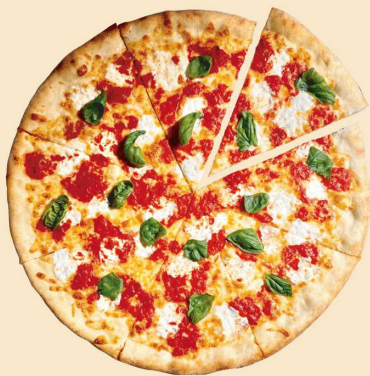
ニューヨーク・マルゲリータ NEW YORK MARGHERITA SLICE: ¥600 (¥648) WHOLE: ¥4000 (¥4320) (8SLICES)