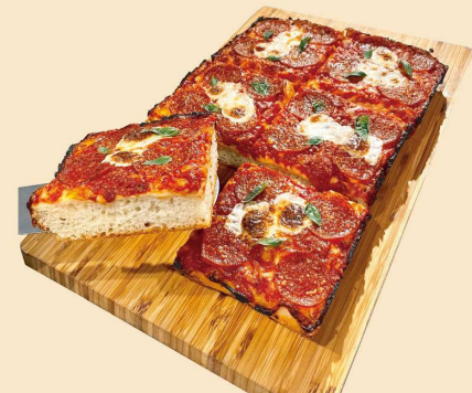
シチリアン SICILIAN PEP SLICE: ¥550 (¥594) WHOLE: ¥4200 (¥4536) (8SLICES)

*Sicilian Style Pizza will take an hour to prepare. シチリアンスタイルピザのホールオーダーは、お作りするのに1時間ほどかかります。