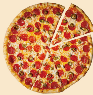
ペパロニ & ハラペーニョ PEPPERONI JALAPENO SLICE: ¥650 (¥702) WHOLE: ¥4500 (¥4860) (8SLICES)