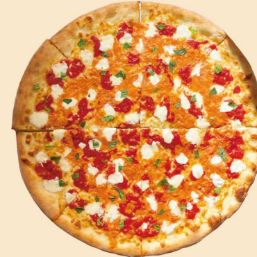
ウォッカ・マルゲリータ VODKA MARGHERITA WHOLE: ¥4900 (¥5292) (8SLICES)