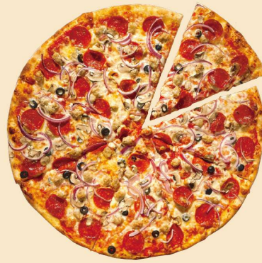
シュプリーム SUPREME SLICE: ¥720 (¥778) WHOLE: ¥4900 (¥5292) (8SLICES)