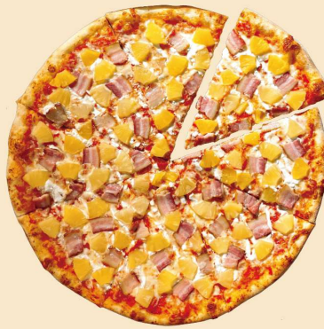
ハワイアン HAWAIIAN SLICE: ¥720 (¥778) WHOLE: ¥4900 (¥5292) (8SLICES)