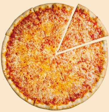
Standard Pizza チーズ CHEESE SLICE: ¥450 (¥486) WHOLE: ¥3500 (¥3780) (8SLICES)

YOU CAN ORDER 20 INCH WHOLE PIE, OR BY THE SLICE